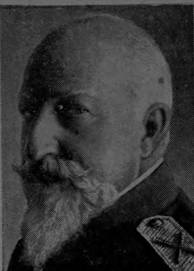
EL EX-REY FERNANDO

Ex-soberano de Bulgaria en cuyo país reinó desde 1908 hasta 1918, año en que abdicó a favor de su hijo, el actual rey Boris. El ex-Rey Fernando mañana cumplirá 74 años de edad.